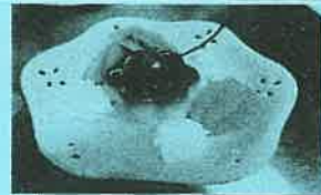
プリン アラモード